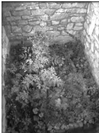
Mezar Ali-dede Iskendera zarastao u korov i šiblje.

tivši se kući ispričao je ženi šta mu se desilo. Sutra ujutro, kada je došao na sabah, klanjao je sām, dobri mu se nije ukazao. Ljudi govore da je keramet prestao zbog toga što je rekao ženi te da bi dobrog i dalje viđao da to nije učinio. No, kao i u ostalim slučajevima, keramet prestane kad drugi za njega saznaju. 7 S vremena na vrijeme u džamiji se noću mogla vidjeti bijela i zelena svjetlost, što je izazivalo nelagodu kod mještana, pa su izbjegavali hodati oko džamije u gluho doba noću. Prema pričanju svjedoka, kada je džamija zapaljena 1992. godine, iznad nje se vidio zeleni dim poput oblaka. 8 Jasno je, na osnovu navedenog, da su džamija i grob Ali-dede Iskendera zauzimali posebno mjesto u svijesti i vjerovanju lokalnog stanovništva.