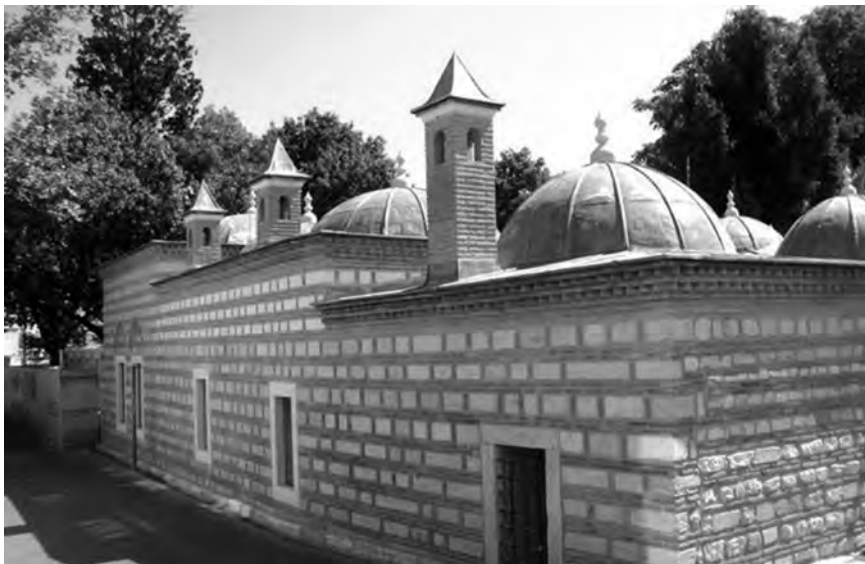
Nişanca, Davut Ağa Caddesi - Eyüp

kao daru-l-hadis 8 , po volji i želji kazaskera 9 Anadolije, Čankirili Mustafa-efendije (pr. 1679). Godine 1745, zgrada je odlukom sina kazaskera Mustafa-efendije, tadašnjeg šejhu-l-islama 10 Damadzadea Ebu-l-Hajra Ahmed-efendije (pr. 1742) preobraćena u nakšibendijsku tekiju i predata šejhu Muhammedu el-Buhariju. 11