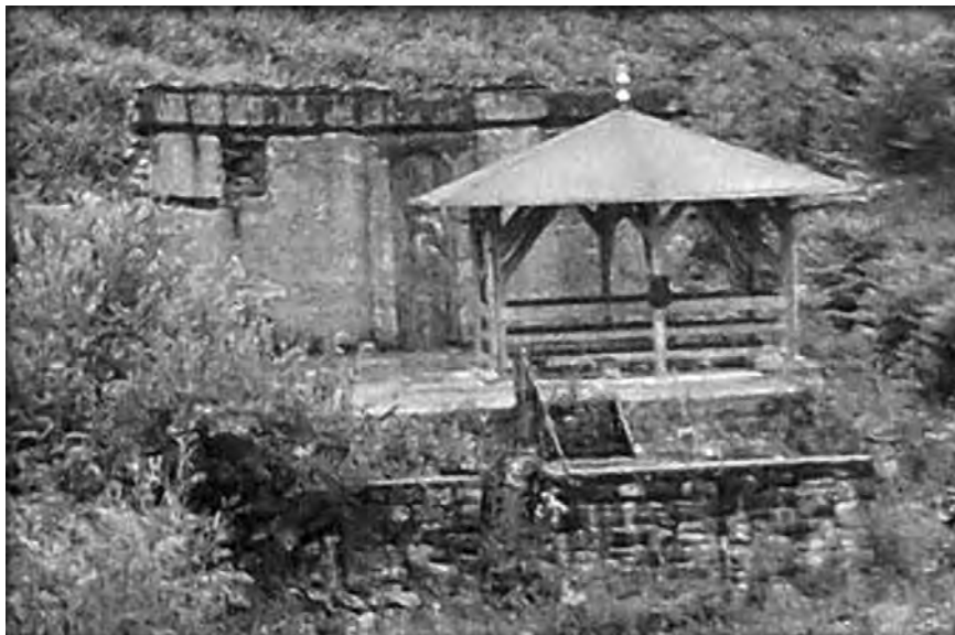
Džamija Ali-dede Iskendera danas. Ispod nadsvođenog prostora je mezar Ali-dede.

Mještani su iznad njega stavili drvenu ogradu s osmougaonim krovom prekrivnim šindrom. Prostor oko džamije je zapušten, zarastao u korov i šibljje.