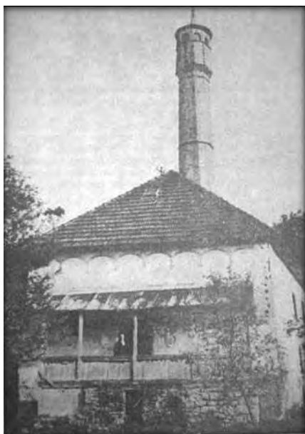
Stara džamija Ali-dede Iskendera.

Pošto se ni džamija ni Skender-Vakuf ne spominju u Opširnom popisu Bosanskog sandžaka iz 1604. godine , a 1692. i 1693. godine se navode već dvojica imama džamije, od kojih je jedan napustio dužnost usljed starosti, možemo sa priličnom sigurnošću konstatirati da je džamija